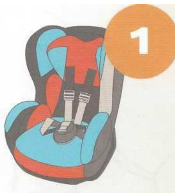
9-18 кг от 9 месяцев до 4 лет