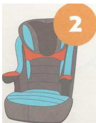
15-25 кг от 3 до 7 лет