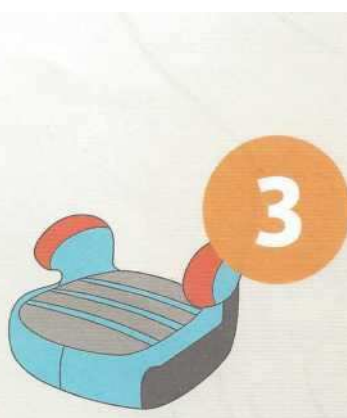
22-36 кг от 6 до 12 лет