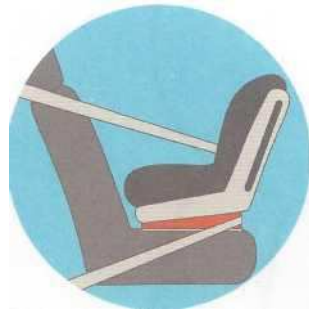
Лицом против движения