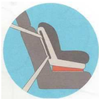
Лицом по ходу движения

Самое безопасное место для установки детского кресла в автомобиле — среднее место на заднем сиденье. Самое небезопасное - переднее пассажирское сиденье. Туда автокресло ставится в крайнем случае, при обязательно отключенной подушке безопасности.