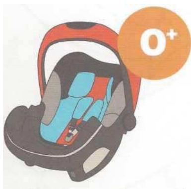
0-13 кг от рождения до 1 года

Покупайте кресло вместе с ребенком. Пусть он попробует посидеть в нем - прямо в магазине.